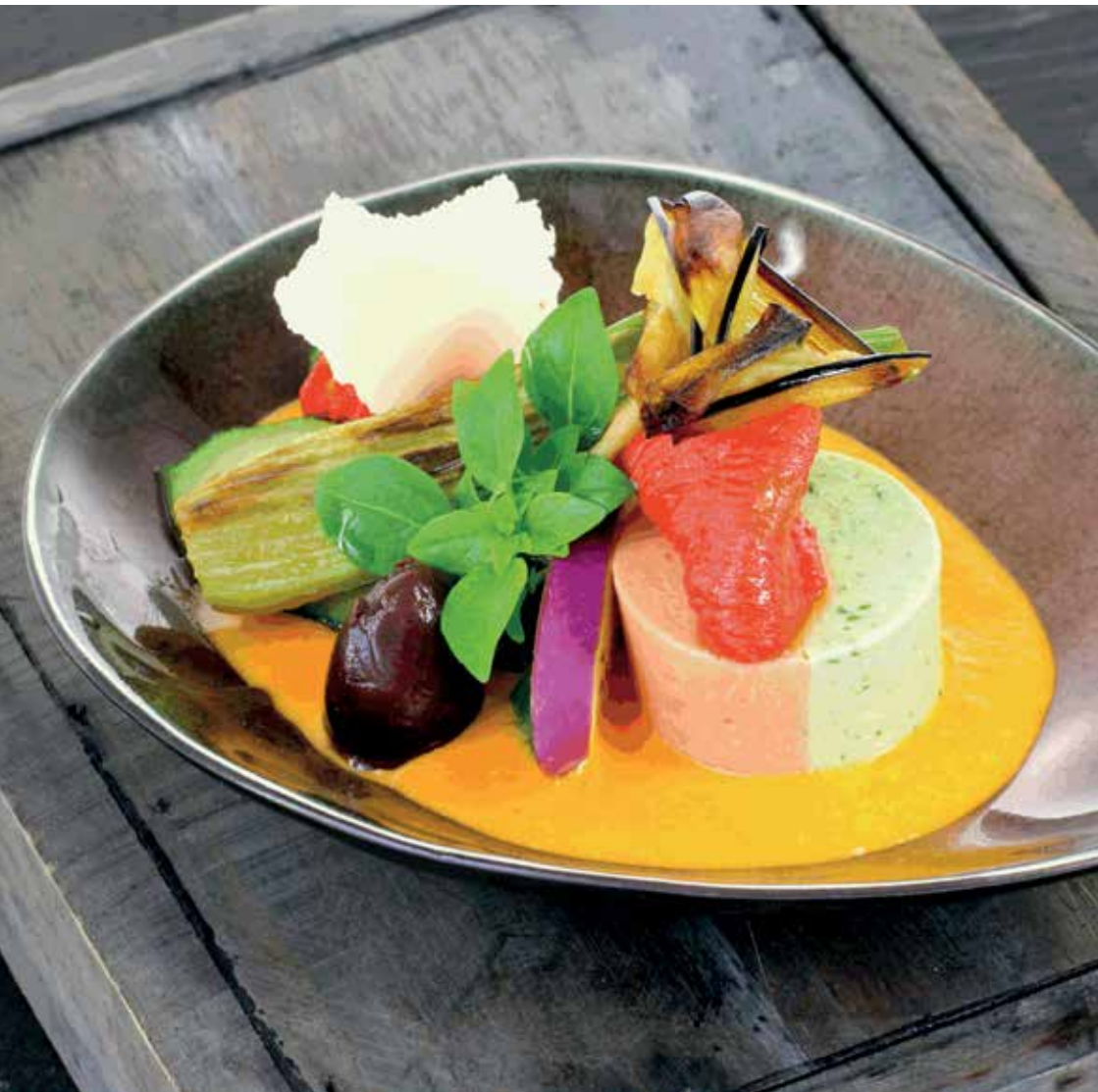
Foto: Dallmayr (ISO 22000 und „Sustainable Company“ zertifiziert)

Mit Dallmayr Party & Catering haben Sie immer einen verlässlichen Partner an Ihrer Seite. Zeitgemäß, innovativ, besonders, überraschend – Dallmayr Party & Catering setzt individuelle Akzente und wird Ihre Erwartungen an einen Top Event Caterer übertreffen. Herzblut und Passion, kompetente Planung, perfekte Organisation, kreative Ideen, ‚State of the Art‘– Konzeptionen, Budgettreue und eine charmante Servicedienstleistung – das ist Dallmayr Party & Catering.