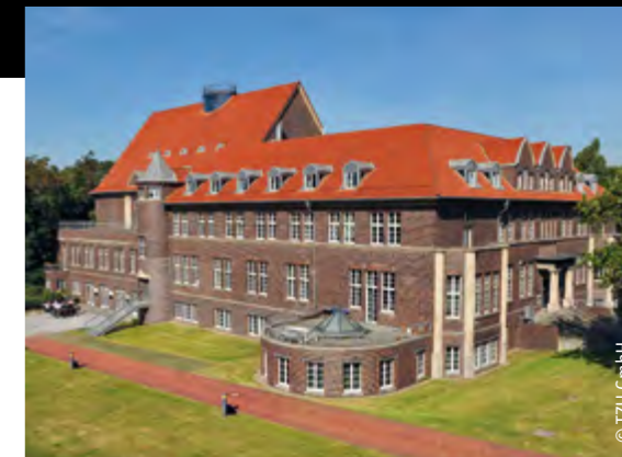
Die Historie der Metropole Ruhr kann im LVR-Industriemuseum erlebt werden. Das Technologiezentrum Umweltschutz bietet Veranstaltungen im klassischen Rahmen.

Ob LVR-Industriemuseum mit authentischer Industrielatmosphäre oder die klassischen Kongresszentren wie das Kongresszentrum Oberhausen Luise-Albertz-Halle und das Technologiezentrum Umweltschutz (TZU): Oberhausen bietet jede Menge Raum für die Umsetzung Ihrer Ideen.