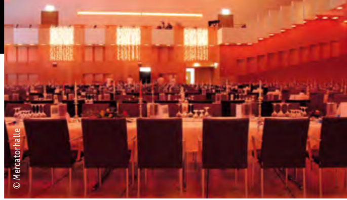
Von wegen altes Eisen: das ehemalige Hüttenwerk im Duisburger Norden gehört zu den beliebtesten Veranstaltungsorten des Ruhrgebiets. Von Kongress bis Gala bietet die Mercatorhalle Duisburg viele Möglichkeiten.